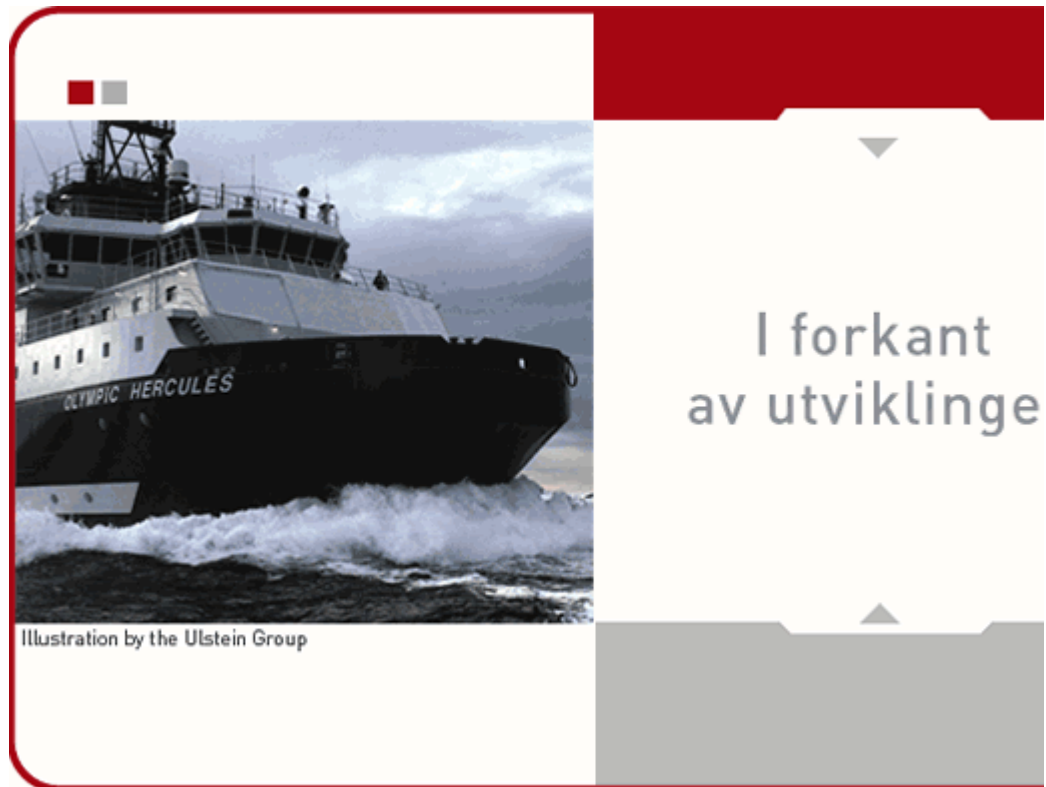
Illustration by the Ulstein Group